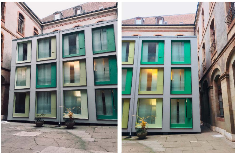
„Provisorischer Pavillon“ im Innenhof des Palais de justice, Genf

Und noch eine Anekdote: Um noch etwas zum Thema beizusteuern, welches man „Kohärenzbruch des staatlichen Handelns“ nennen könnte, wollen wir auch den kuriosen „provisorischen (1) Pavillon“ im Innenhof des Justizpalasts, des Palais de justice , erwähnen. Es sei daran erinnert, dass wir uns inmitten eines historischen Gebäudes (2) in einem Teil der Genfer Altstadt befinden, für den besonders strenge Denkmalschutzauflagen gelten... Ein solches „Gebäude“ trägt nicht unbedingt zur Verbesserung der Glaubwürdigkeit des Staates im Hinblick auf seine Aufgabe als Denkmalschützer bei ( siehe Foto ).