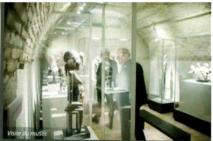
Visite du musée