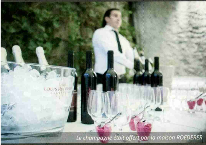
Le champagne était offert par la maison ROEDERER