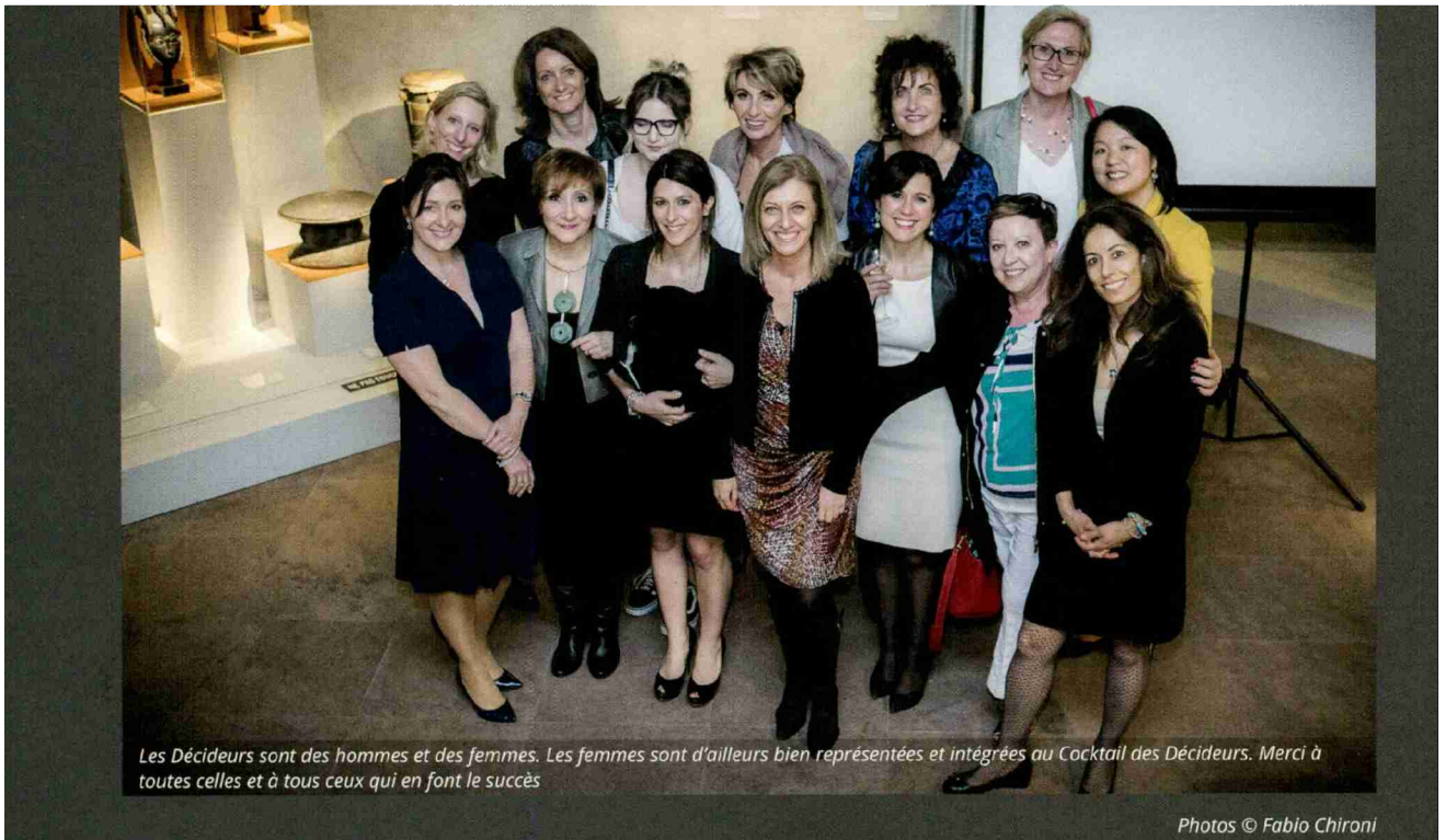
Les Décideurs sont des hommes et des femmes. Les femmes sont d'ailleurs bien représentées et intégrées au Cocktail des Décideurs. Merci à toutes celles et à tous ceux qui en font le succès