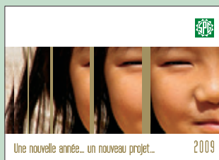
2009: Le Sourire de Chiang Khong / Thaïlande