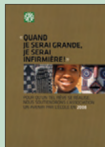
2008: Association un Avenir par l'Ecole / Mali