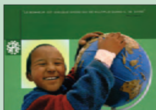
2004: Ecole La Petite Arche Fondation Ensemble / Genève