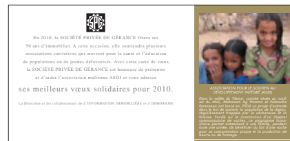
Carte de vœux 2010

Au travers de ses cartes de vœux, pour la nouvelle année 2010, la SOCIÉTÉ PRIVÉE DE GÉRANCE a présenté à tous ses clients et partenaires l'ASDI, l'Association pour le Soutien au Développement Intégré de Moudatt, qui œuvre pour la santé et l'éducation de populations et de jeunes défavorisés au Mali.