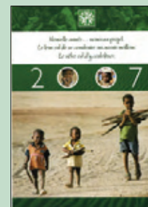
2007: Association d'Aide à Gao / Mali