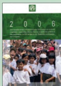
2006: Maison Chance Suisse / Vietnam